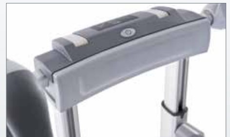
Komfortpolster: zum Ablegen der Bedieneinheit auf dem Oberschenkel